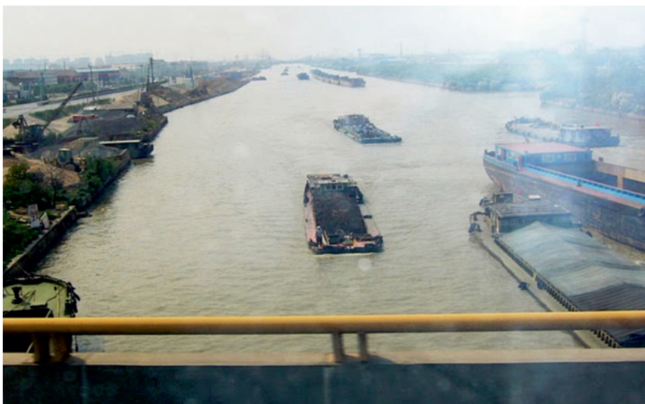
Il più grande canale interno mai costruito dall'uomo "Jing Hang" (CINA)

(ndr il porto di Venezia avrebbe ben altro peso in questa trattativa con la Regione Friuli, se potesse aggiungere alle sue anche le infrastrutture idrovie interne : da Padova a Chioggia a Rovigo.....)